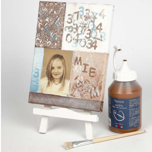
Foto overført til lerret