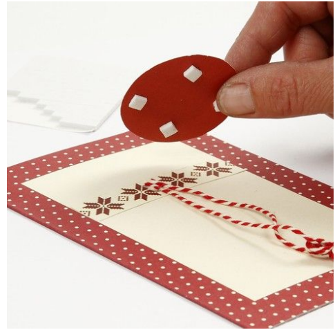
8. Monteres på kortet med 3D puter.