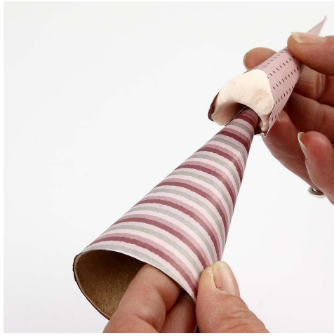
7. Sett luen på kjeglen.