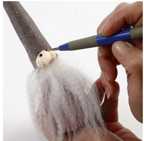
10. Form ansiktet og sett perler på som øyne.