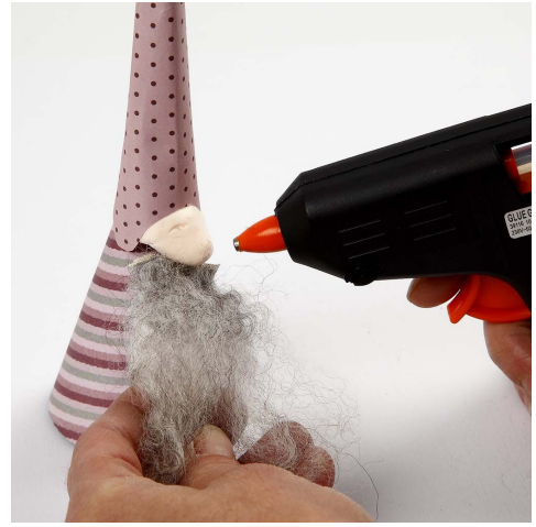
8. Lim på skjegg.