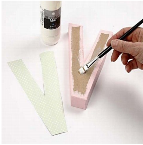
3. Papiret limes på med decoupageglakk.