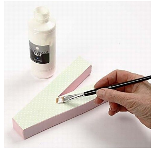
4. Papiret lakkeres.