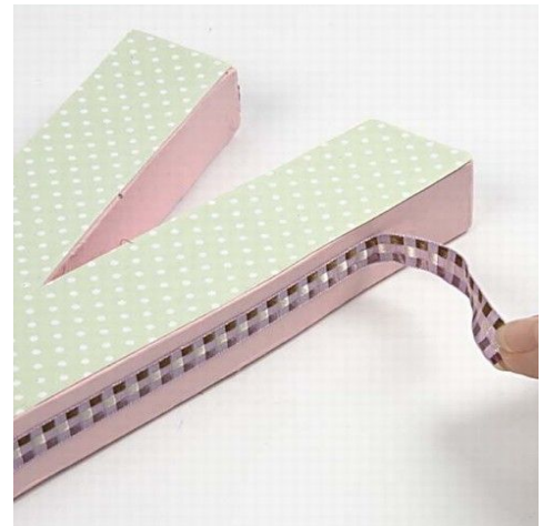
6. Båndet dekorerer på bokstavene.