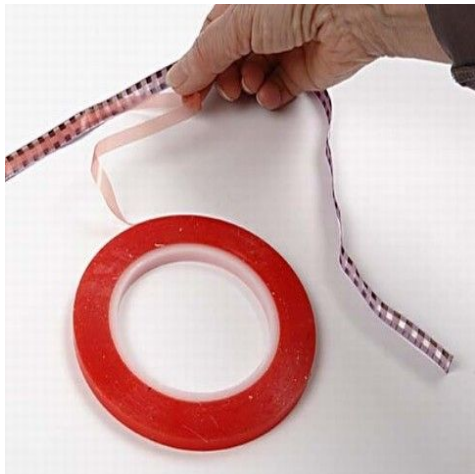
5. Powertape settes på båndet.