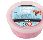
Foam Clay®, lys rød, glitter, 35g 78862