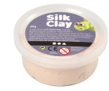
Silk Clay®, lys hud, 40g 79111

Egg, H: 3,7 cm, hvit, isopor, 10stk. 543261