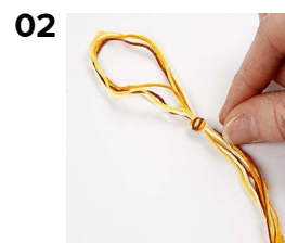
02 Brett på midten og knytt en knute ca. 10 cm fra enden.