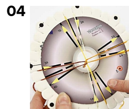
04 Før snøret fra 1A til 1B, 2A til 2B, 3A til 3B og 4A til 4B. Dette er en omgang. Etter hver omgang dreies skiven rundt, slik at snørene igjen kommer til å ligge på en lys rød prikk.