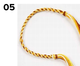
05 Knytt en knute når armbåndet har ønsket lengde.