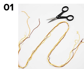
01 Klipp 4 snører á ca. 80 cm.