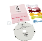
Kumihimo startsett, 1sett 41592